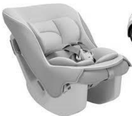
チャイルドシート