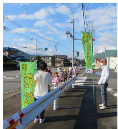
あいさつ運動の様子