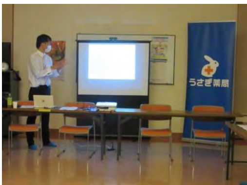
うさぎ薬局による講座