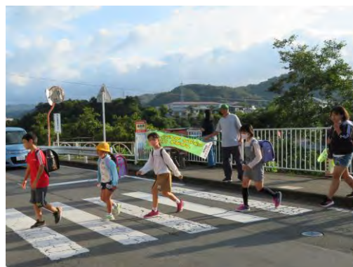
あいさつ運動の様子