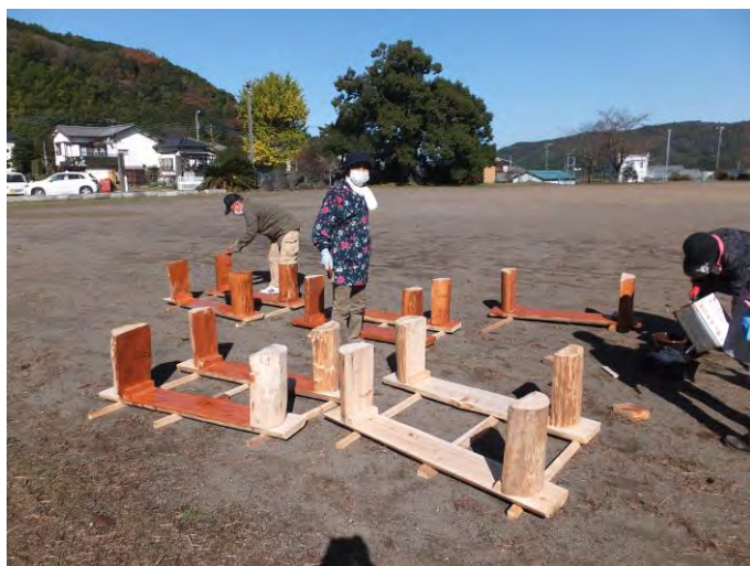
↑ ベンチ作業の様子