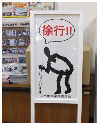
↑ 新しく作製した看板