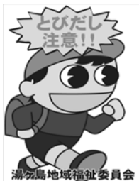
湯ヶ島地域福祉委員会