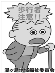
湯ヶ島地域福祉委員会