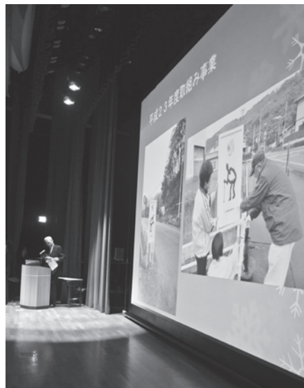
八岳地域福祉委員会