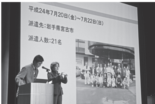
被災地支援ボランティア