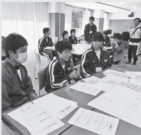
中学生向け福祉体験のようす