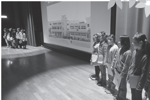
中伊豆小学校 3年生