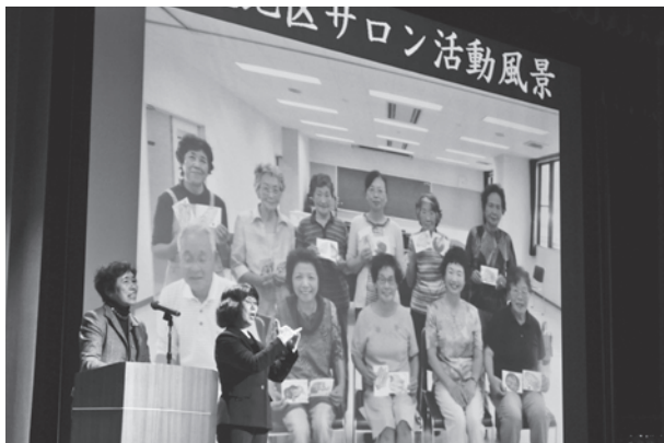
土肥地区サロンボランティア