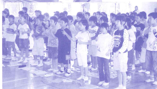
修善寺南小学校 4 年生