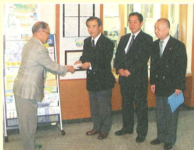
天城湯ヶ島ライオンズクラブの皆さま