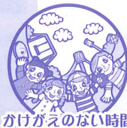
かけがえない時間

ボランティアには学校でも、家庭でも、会社でも得ることができない自分へのご褒美があります。もしかしたら、これからの自分にとって何が大切なのか、ボランティア活動を通じて発見することができるかもしれません。