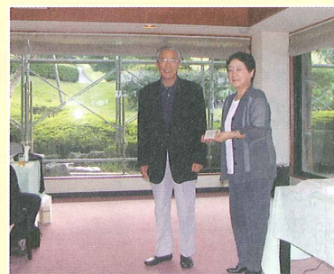
(株)クリエイト L & Sの皆さま

皆さまの善意が有効に活かされるよう、ふれあいサロン・一人暮らし高齢者配食サービス事業などの地域での福祉活動の場に活用させていただきます。皆さま、社協活動へのご理解・ご協力誠にありがとうございます。