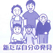
新たな自分の発見

想いを行動に移してみませんか？ ボランティアの窓口は社協です。社協は、ボランティアをしたい人、ボランティアを受けたい人をつなげる「架け橋」になっております。ボランティアに関する相談、情報提供、活動の調整をさせていただきます。まずは、ご相談ください。