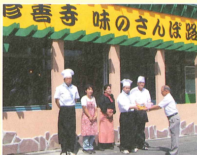
味のさんぼ路の皆さま