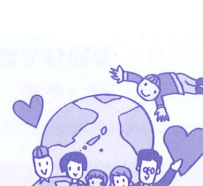
世代・国境を超えた 素敵な出会い