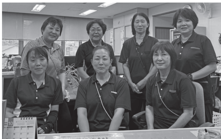
「アットホームなヘルパーがサポートします」