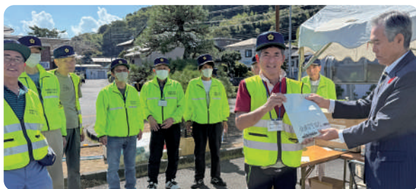
▲交通安全協会伊豆中央地区支部修善寺分会の皆さん