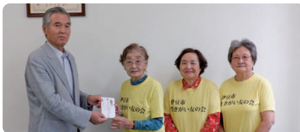
▲生きがい友の会の皆さん