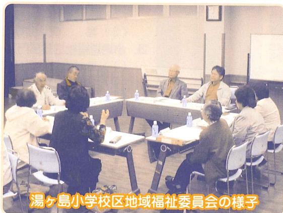
湯ヶ島小学校区地域福祉委員会の様子