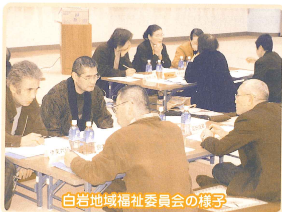
白岩地域福祉委員会の様子