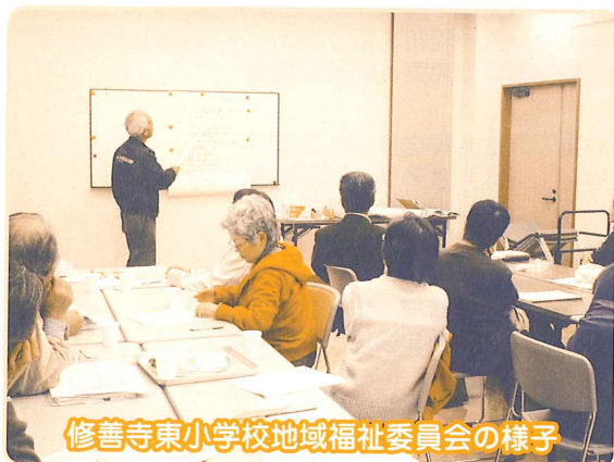
修善寺東小学校地域福祉委員会の様子

支援を必要としている人たちの生活上のさまざまな課題を地域全体で支え、住民相互の助け合い活動を進めるための組織が地域福祉委員会です。