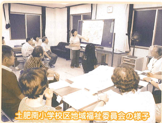
土肥南小学校区地域福祉委員会の様子