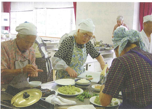
一人暮らし高齢者料理教室