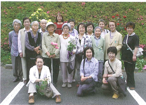
一人暮らし高齢者遠足