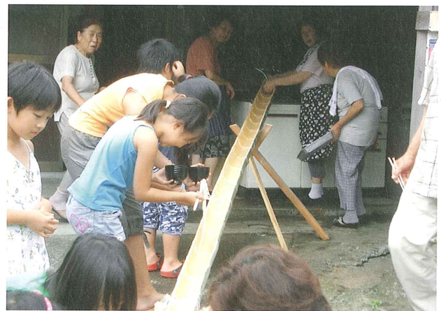
ふれあいいきいきサロン