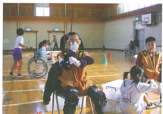
福祉教育(高齢者疑似体験)

平成20年度は、域福祉活動計画に基づき、会費・共同募金の財源により、さまざまな事業を実施いたしました。事業報告・決算報告は、P2～P5に掲載。