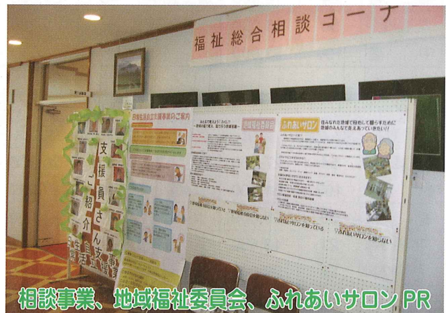
相談事業、地域福祉委員会、ふれあいサロンPR

社協の事業のPRを行いました。屋外では、共同募金のPRと共に、フライドポテトの売上を基に子育て応援事業の遊具の購入資金にご協力いただきました。又、災害ボランティアセンターのPR、移送車両の展示、操作説明、移送サービス事業のPRを行いました。又、子育て応援事業の一環として、お母さんたちによる、フリーマーケットを開催いたしました。屋内の展示では、福祉総合相談コーナー、地域福祉委員会、ふれあいサロンなどそれぞれの事業のPRを行いました。