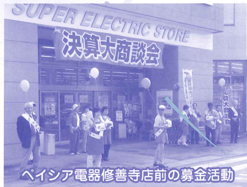
ベイシア電器修善寺店前の募金活動

市内各金融機関やコンビニ等にポスターの掲示とキャラクター募金箱の設置をお願いいたしました。ご協力ありがとうございます。