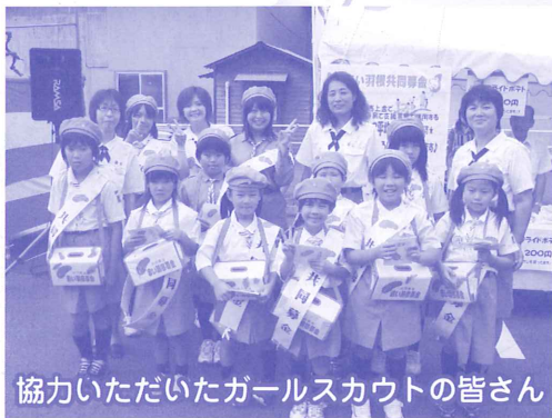
協力いただいたガールスカウトの皆さん

多くの皆さまからご協力をいただくことができました。ほんとうにありがとうございました。