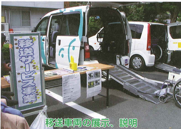
移送車両の展示、説明