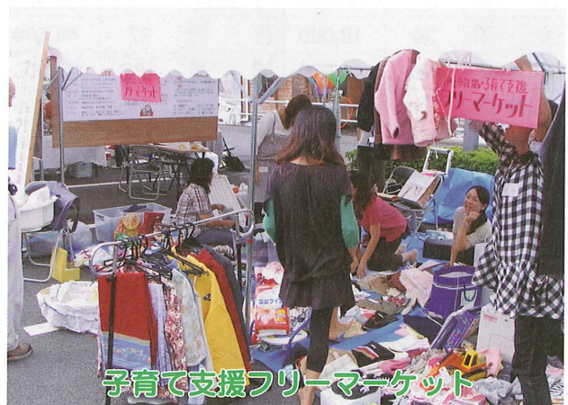
子育て支援フリーマーケット