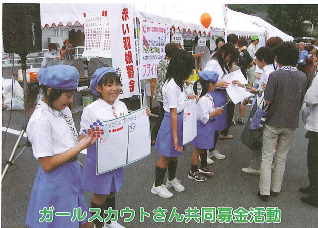
ガールスカウトさん共同募金活動