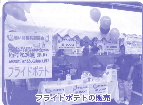
フライドポテトの販売