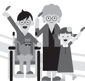
誰かの願いが叶う